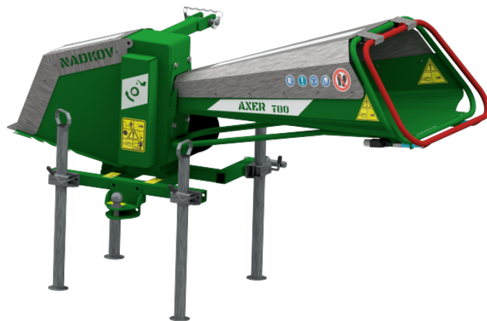
ŠPALÍKOVACĚ ENTRY AXER T80

Jedná se o funkční stavebnici, ke které je možné dokoupit další komponenty. Například: transportní segment násypky, kryty ložisek, bezpečnosti samolepky, nastavitelné nohy, závěs pro vleč, sklopná násypka, řezná hlava umožňující nastavovat délku produkovaného materiálu (10,20,40cm). Možné jsou další úpravy dle přání zákazníka.