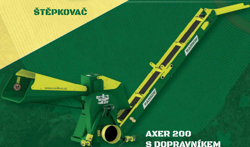
AXER 200 S DOPRAVNÍKEM