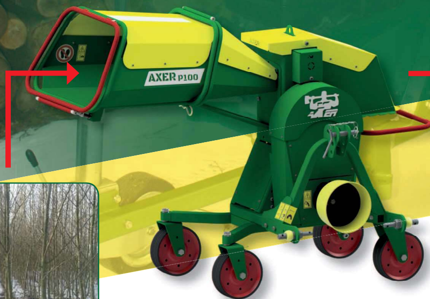
AXER P100 OPTIMAL