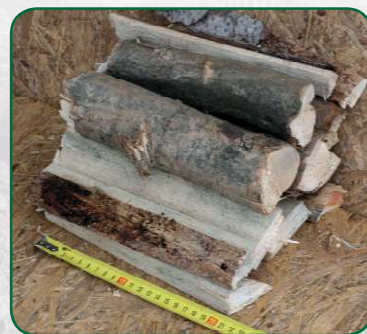
Délka špalíků 20 cm