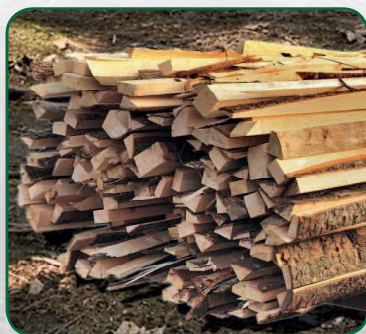
Zbytky z pilařských provozů a další materiály