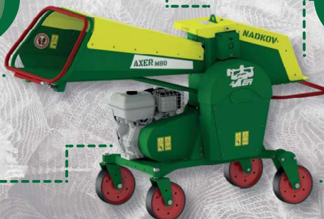
AXER M80 INDIVIDUAL

PODVOZEK kolový, tažná oj, nastavitelné nohy, terénní náprava