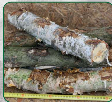
Délka špalíků 40 cm