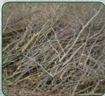
Větve z lesů, ze sadu