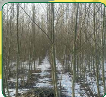
Rychle rostoucí dřeviny (topol, vrba)