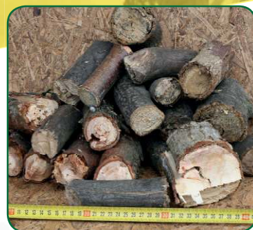
Délka špalíků 10 cm