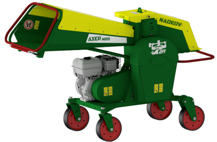
AXER M80 STANDARD

Stavebnicová koncepce stroje, vývojové kapacity a orientace na zákazníka umožňují upravit stroj přesně podle individuálních potřeb.